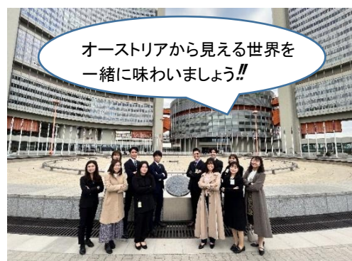
2022年度 第二陣/国連機構の中庭にて