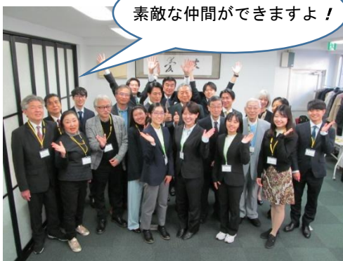
友愛勉強会・懇親会でのひとこま